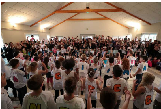
Les élèves face à leur public lors de la fête de l'école