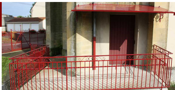
La nouvelle rampe de l'église

D'autre part, les défauts observés lors de la rénovation des parquets faite en 2013 ont enfin été corrigés.