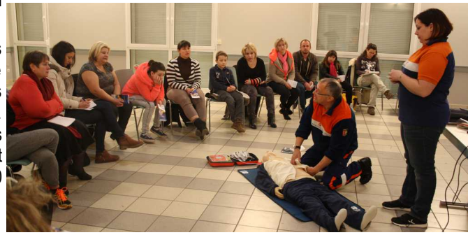
Exercice de réanimation avec la Protection Civile

Les participants étaient majoritairement féminins et intéressés. Si d'autres administrés le souhaitent, ils peuvent s'inscrire en Mairie. Dans le même esprit, au-delà du défibrillateur, M. BOULOT propose une formation aux premiers secours, en 2 ou 3 séances, pour un coût individuel de 65 €, ou 500 € par groupe de 10 personnes (inscription en Mairie).