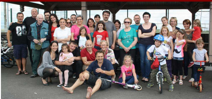
Les voisins du secteur de la route de Rémillly